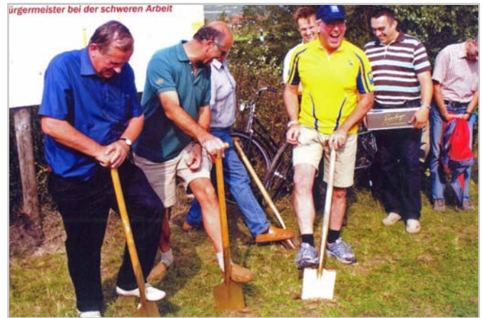
Spatenstich zum Radwegenetz

Der 19. September ist auch der jährlich stattfindende RADLrekordTAG im Rahmen der Europäischen Mobilitätswoche, der heuer unter dem Motto „Rückeroberung der Straßen für