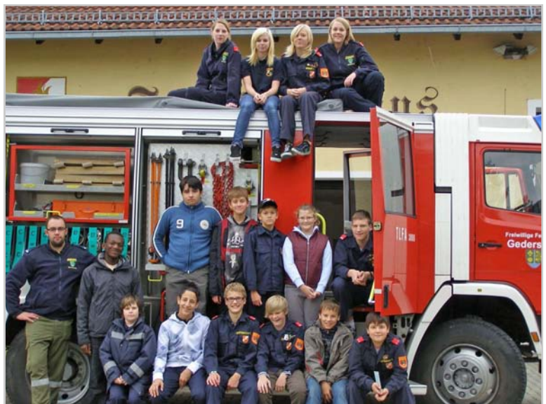
Jugendgruppe der FF Gedersdorf

Die Jugendstunde findet samstags jeweils von 13:00 bis 15:00 Uhr im Feuerwehrhaus Brunn statt.