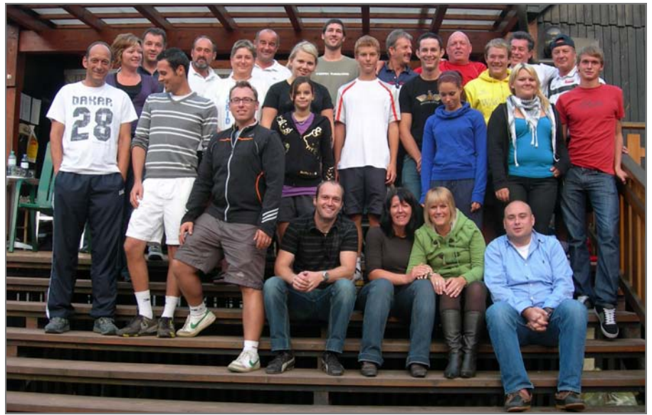
Gemeinsame Klubmeisterschaft des UTC Gedersdorf und UTC Hadersdorf

In diesem Sinne wünscht der UTC Gedersdorf allen Mitgliedern und GemeindebürgerInnen ein frohes Weihnachtsfest sowie einen guten Start ins neue Jahr!