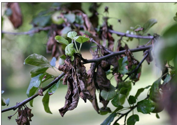
Apfelbaum - befallen vom Feuerbrand

Der Feuerbrand-Beauftragte wird die Pflanzen besichtigen und alle weiteren Schritte in die Wege leiten.