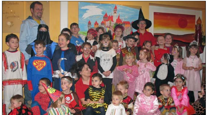
Das Faschingsfest der „Kleinen“

Die Kinderfreunde Gedersdorf bedanken sich bei allen Eltern für den zahlreichen Besuch und bei allen SpenderInnen der Tombolapreise.