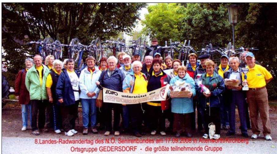
8. Landes-Radwandertag des N.O. Senirenbundes am 17.09.2008 in Altenwörth/Kirchberg Ortsgruppe GEDERSDORF - die größte teilnehmende Gruppe

Eine kleine Vorschau auf 2009 wagten wir am 6. 11. im Gasthaus Knechtl. Moser Reisen brachte eine Diaschau über Rhodos, wohin die Frühjahrsreise des Seniorenbundes führen wird.