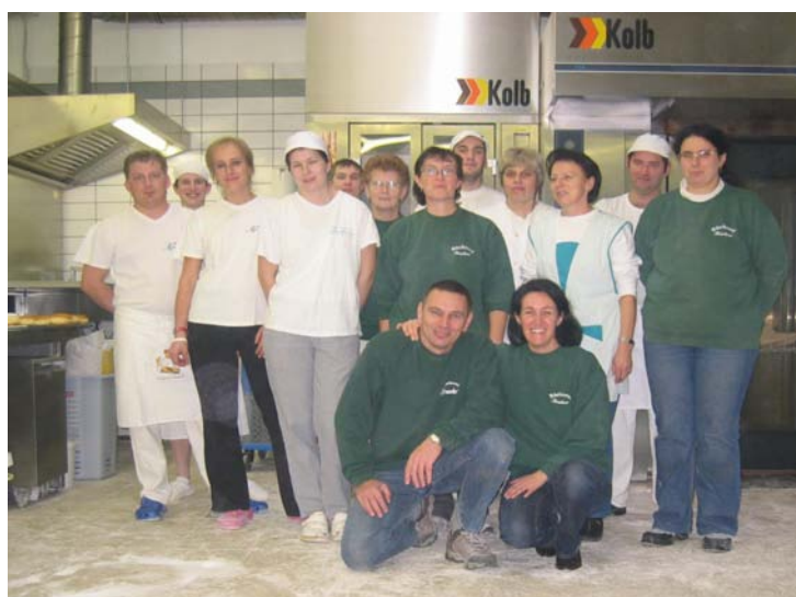
aus der Region - für die Region

Wir wünschen Euch fröhliche Weihnachten,