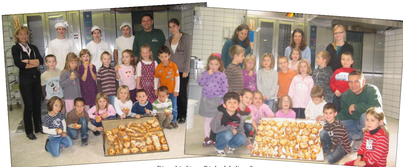
Die zukünftigen Bäckerlehrlinge?

Zwei Gruppen des Kindergartens besuchten die Bäckerei Bruckner. Die Kinder durften Krapfen mit leckerer Vanillecreme füllen und formten aus Briocheteig Krampusse und Schnecken usw. Nach dem Ausbacken wurden die Köstlichkeiten natürlich gegessen. Das war die Belohnung für die „harte Arbeit“.