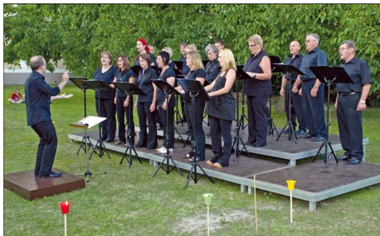
Das Theißer Open Air

Aus eigener Erfahrung kann ich Ihnen sagen: Singen ist geil!